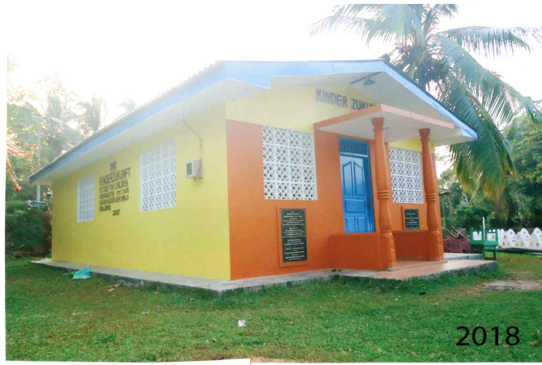
Wiederaufbau Kindergarten "FUTURE FOR CHILDREN"