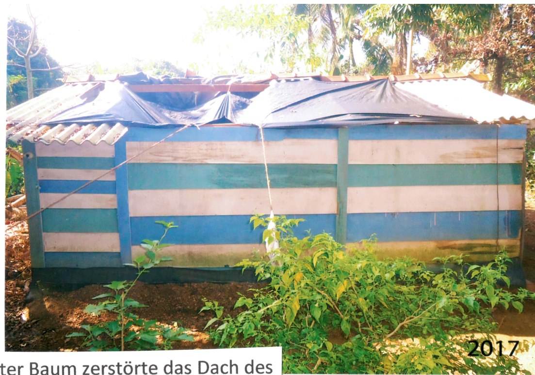
Ein durch den Zyklon umgestürzter Baum zerstörte das Dach des Hauses der Familie Kumara in Pinhena/Beruwala.