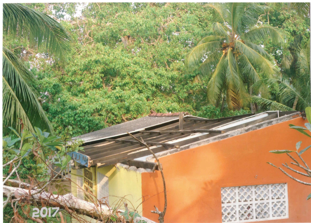
Zyklon am 30. November 2017 in Beruwala