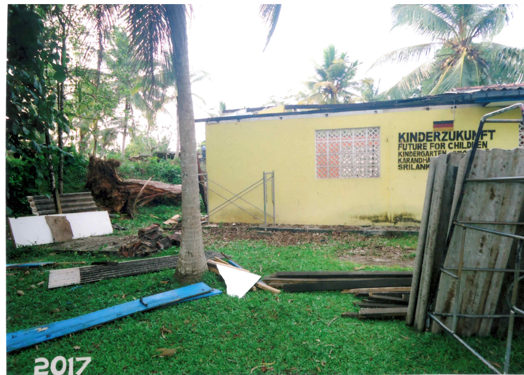
Kindergarten "FUTURE FOR CHILDREN"