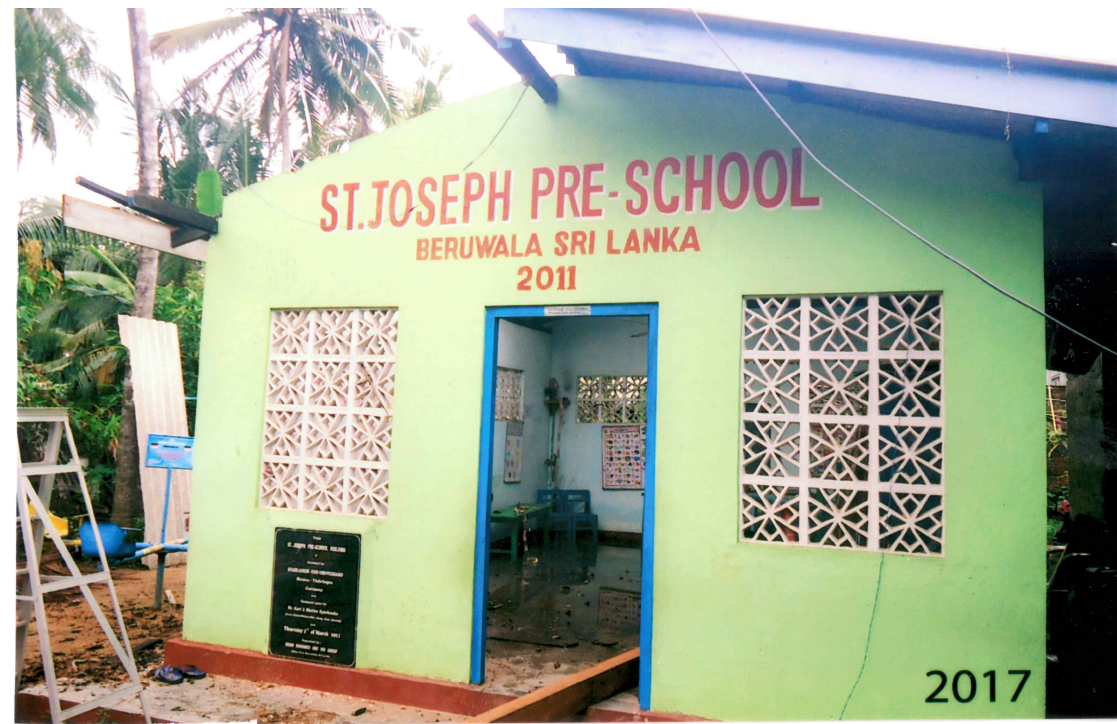
Auch der von uns errichtete Kindergarten ST. JOSEPH PRE-SCHOOL wurde vom Zyklon schwer beschädigt.