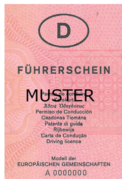
z.B. grauer Papierführerschein oder rosa Papierführerschein