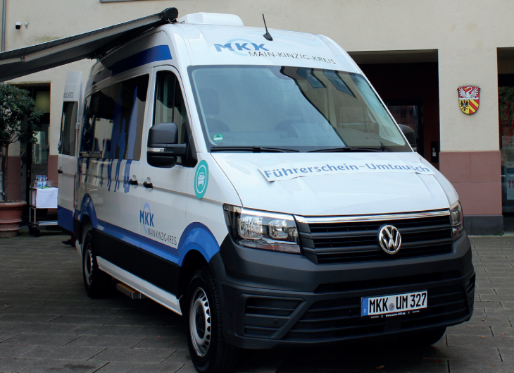
Umtauschmobil des Main-Kinzig-Kreises