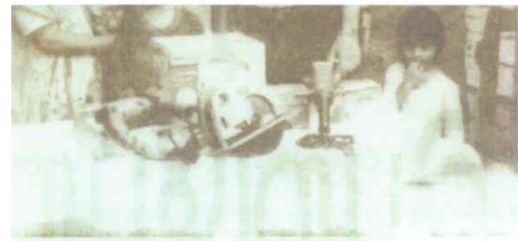
சந்தில் வயிற்று வயிற்றுறைந்த குடும்பங்களுக்கு, ஜெர்மனி-லாஸ் மீள்தீர்வு நி. உபகரணத் தொகுதிகளை அன்பளிப்புச் செய்திருந்தார். அவ்வாறு செய்து கொண்டுள்ள குடும்பம் ஒன்றுடன் கூடும், தமது உபகரணங்களைக் கொடுக்கின்ற இல்லம் குடும்பம் ஆகியோர் நினைவுகளைக் (வ-123)