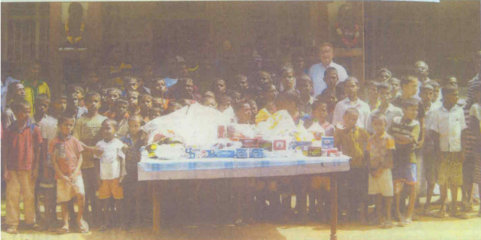
Lebensmittel für 250 Waisenkinder. Von Main-Kinzig-Bürgern gespendete Lebensmittel lindern die größte Not. Jetzt gilt es, die beiden Waisenhäuser dauerhaft zu versorgen.