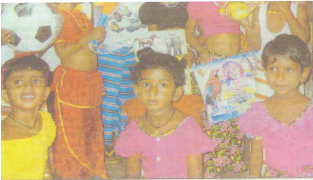
Leuchtende Augen: Spielsachen sorgen bei den Kindern von Beruwala für Spaß und Lebensfreude.