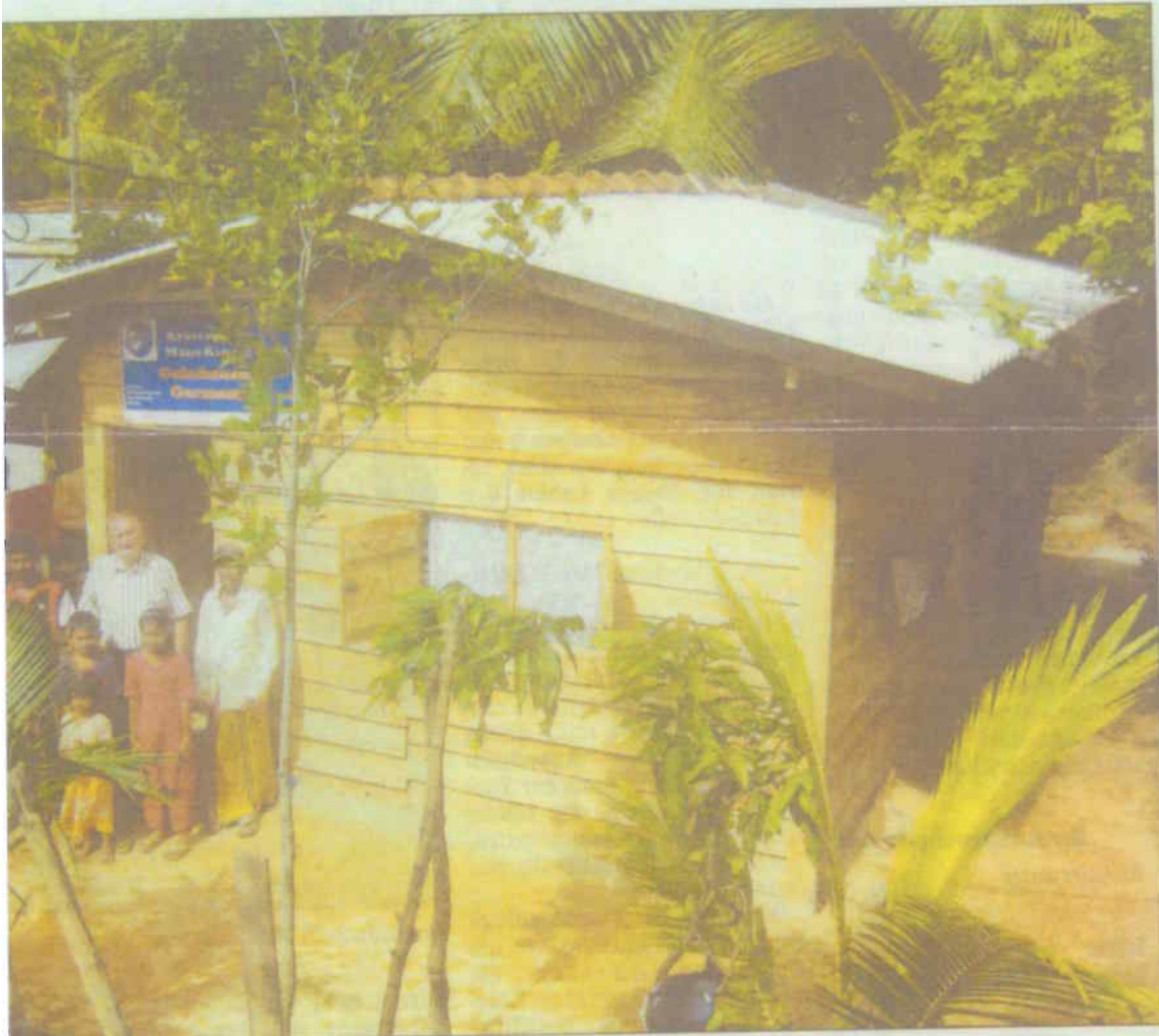
Material für so ein Haus, das ein Leben unter Plastikplanen beendet.