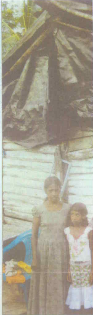
Vergessene Opfer: Im fünften Jahr nach dem Tsunami sind Familien noch immer in erbärmlichen Unterkünften untergebracht.